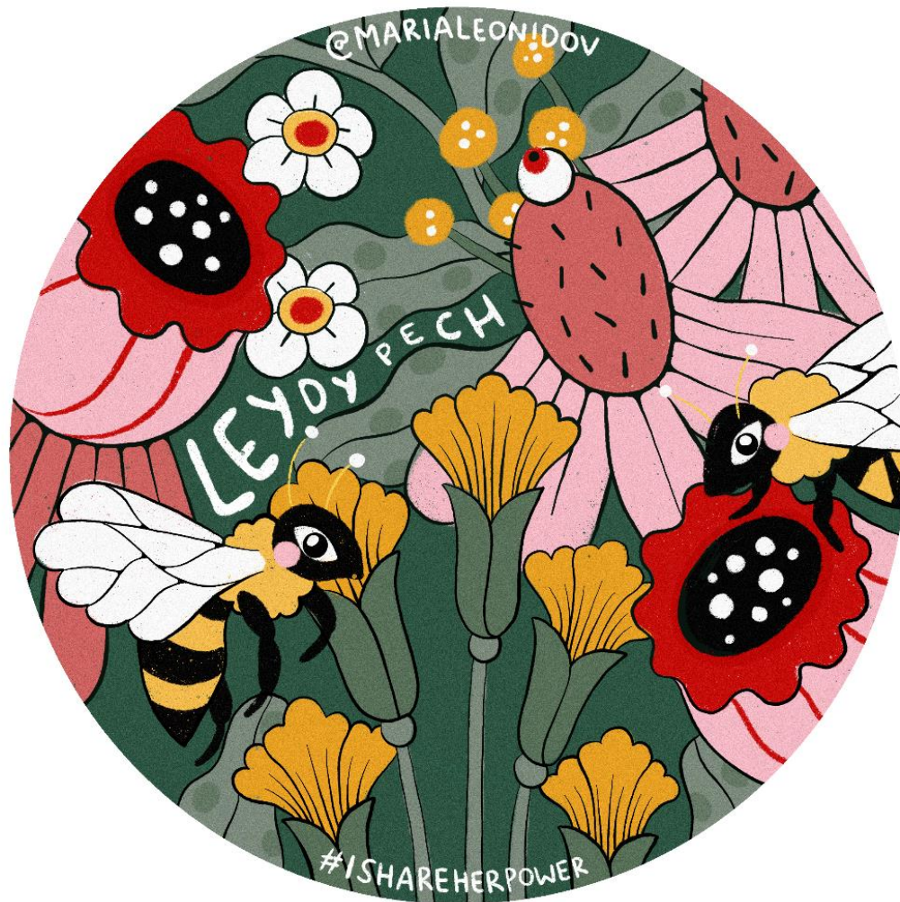
Autorka samolepkyt: Maria-Liisa Leonidov